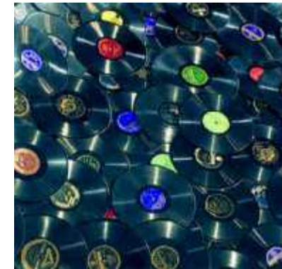
© JEAN SHIN / BROOKLYN ACADEMY OF MUSIC

Boxon Records déstocke utile et agréable p.5